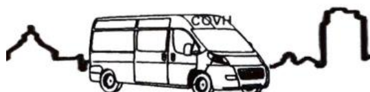
Collectief Ouderen Vervoer Heusden

vieringen vinden plaats in de kapel van zorgcentrum Sint Antonius. De derde zaterdag van de maand is de viering in de zaal van de seniorenvereniging ("De Soos") die deel uitmaakt van hetzelfde gebouw.