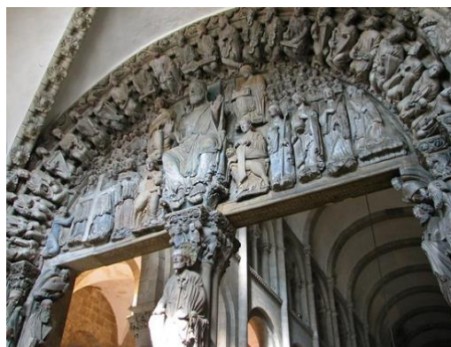
Tympan met het Laatste Oordeel ingang kathedraal Santiago de Compostella

Het einde van de zomer nadert en iedereen probeert zo goed en zo kwaad mogelijk de draad in Coronatijd weer op te pakken. We maken ons allemaal zorgen over de maatschappelijke gevolgen van de pandemie. Velen willen terug naar het normale leven en de economische activiteiten hervatten. Natuurlijk, maar dat 'normale leven' zou niet langer het sociale onrecht en de milieuvuiling moeten behelzen. De pandemie is een crisis en je komt niet uit een crisis als voorheen: of we komen er beter uit, of juist slechter . We zouden er beter uit moeten komen, om het sociale onrecht en de milieuvuiling aan te pakken. We hebben nu de kans om een andere en betere wereld op te bouwen. We kunnen bijvoorbeeld een economie laten ontstaan die gericht is op de ontwikkeling van de armen, en niet alleen op hulpverlening. Daarmee wil ik hulpverleners niet tekortdoen, want hulpverlening is belangrijk. Denk maar aan de mensen van de Voedselbank, Schuldhulpverlening, Vluchtelingenwerk etc.